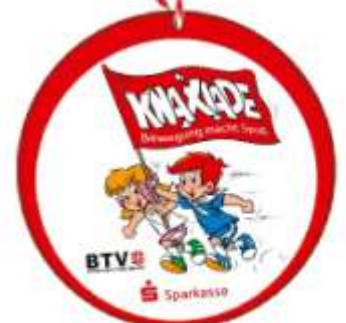
Urkunde (DIN A4) und Medaille