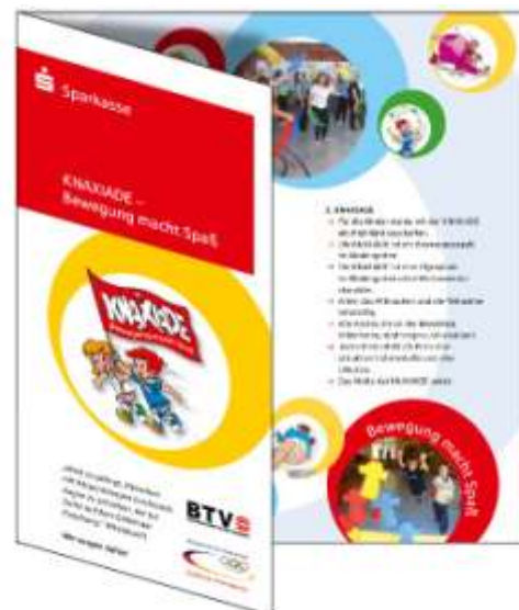
Informationsflyer für die Eltern (DIN lang)