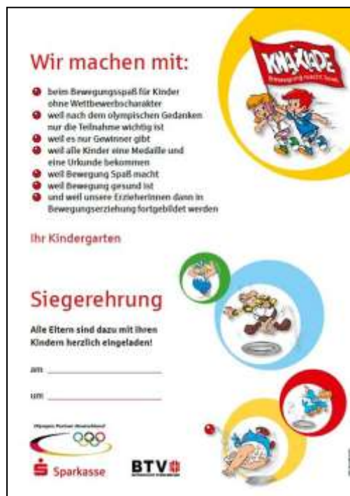
Ankündigungsplakat (DIN A3)