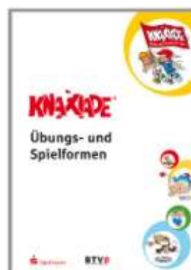
Broschüre (DIN A4)