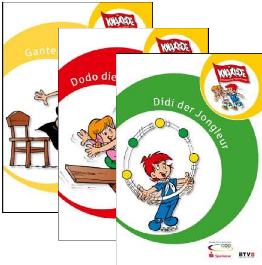
11 Stationsplakate (DIN A3)